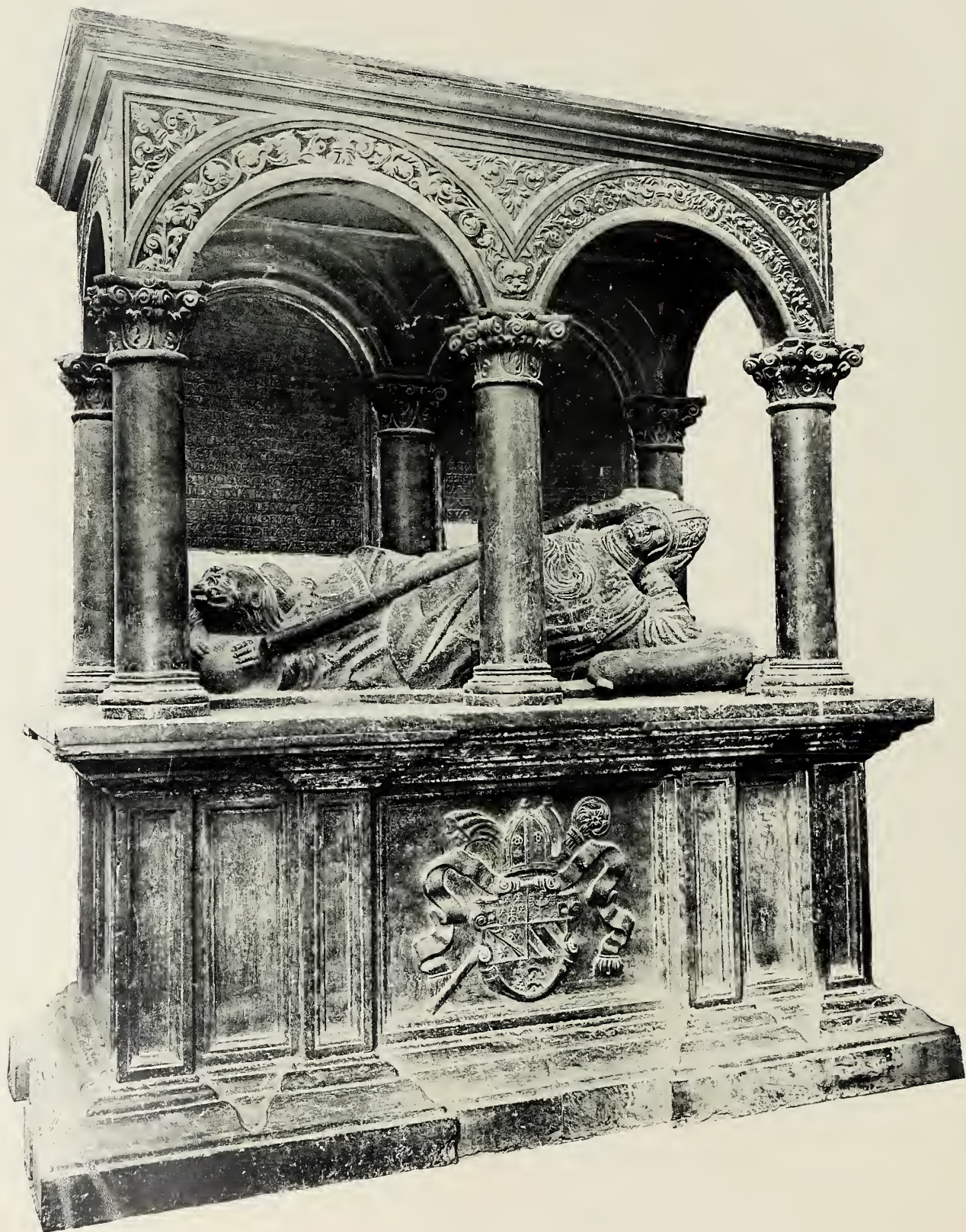
Balthasar von Promnitz.